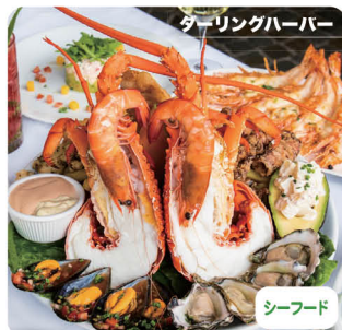
ダーリングハーバー