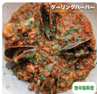
ダーリングハーバー

8 I'm Angus Steak House アイム・アンガス・ステーキハウス