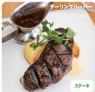
ダーリングハーバー

7 Nick's Seafood Restaurant ニックス・シーフード・レストラン